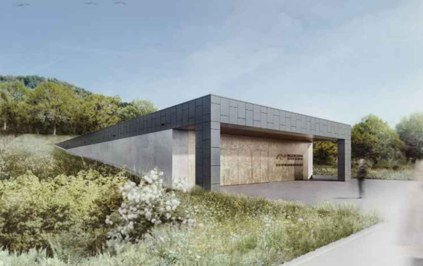
Eingang neues Wasserreservoir mit Betriebsgebäude